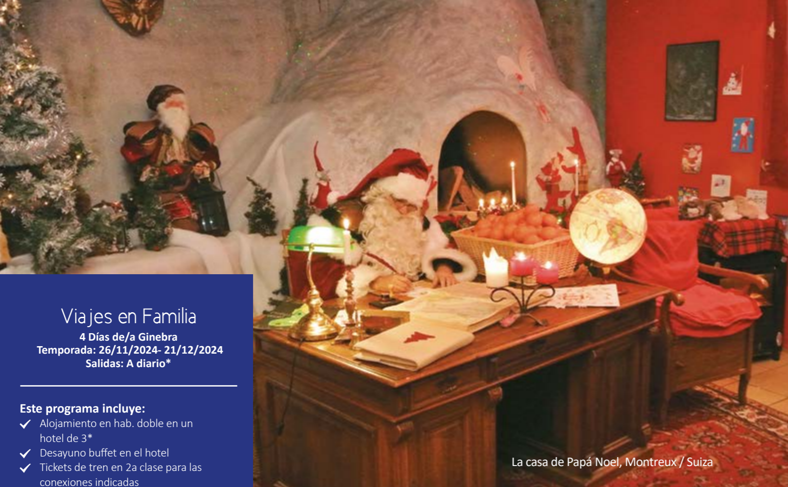
La casa de Papá Noel, Montreux / Suiza