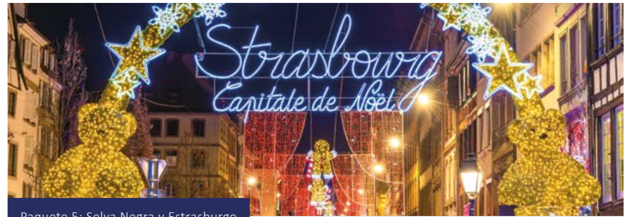
Paquete 5: Selva Negra y Estrasburgo

Si hay suficiente tiempo, puede visitar opcionalmente el mercado de Navidad en Esslingen, famoso por ofrecer un ambiente medieval muy especial. Traslado privado opcional al aeropuerto.