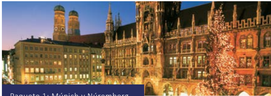
Paquete 1: Múnich y Núremberg