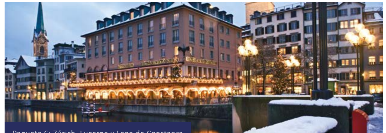
Paquete 6: Zúrich, Lucerna y Lago de Constanza