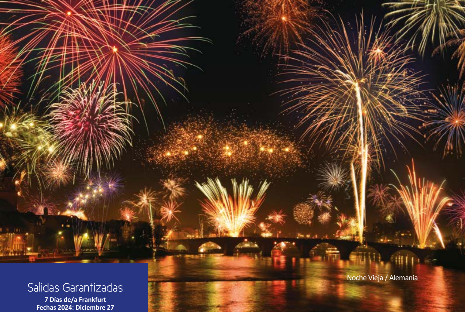
Noche Vieja / Alemania

Salidas Garantizadas 7 Días de/a Frankfurt Fechas 2024: Diciembre 27