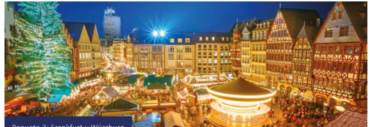
Paquete 3: Frankfurt y Würzburg

Traslado privado opcional al aeropuerto.