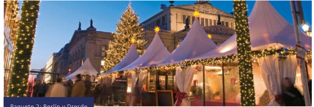
Paquete 2: Berlín y Dresde

Traslado privado opcional al aeropuerto.